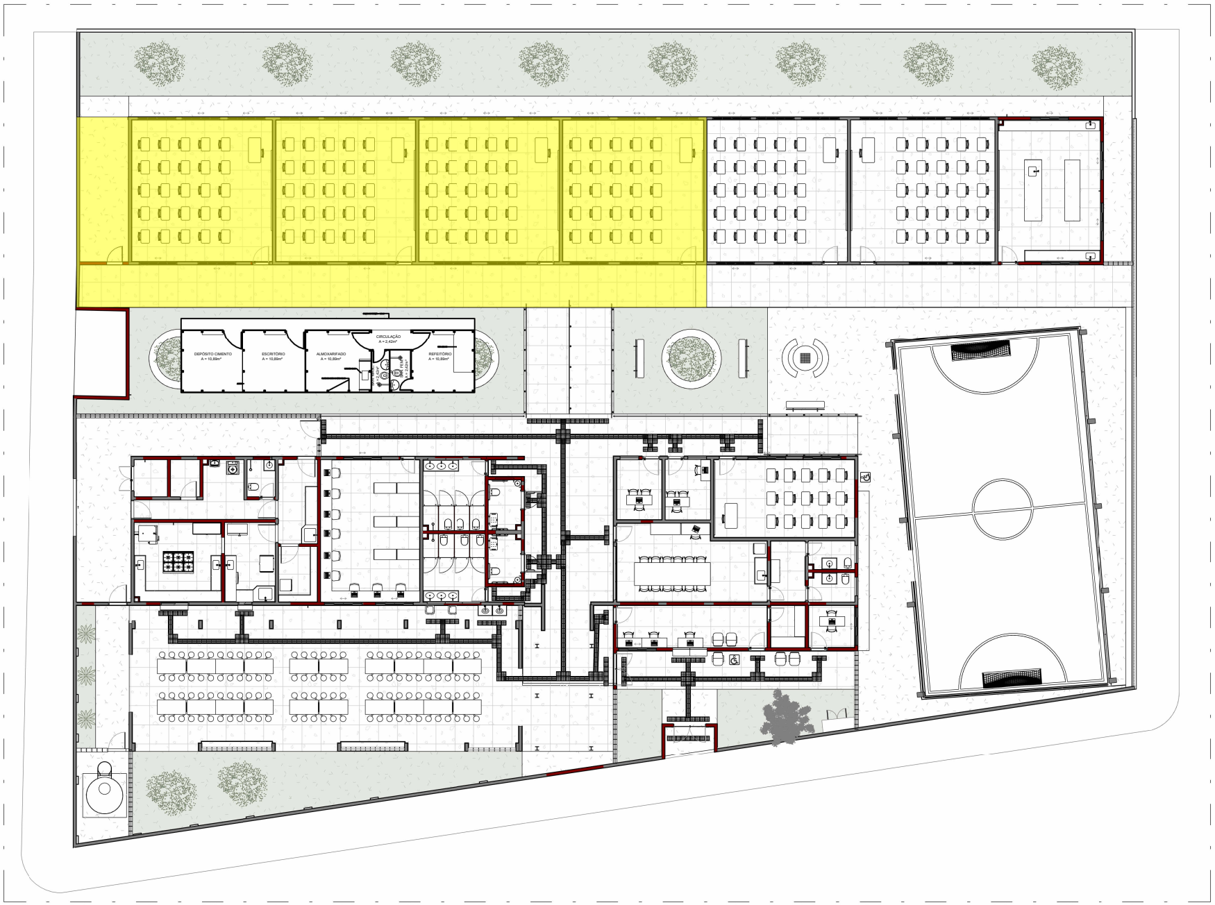
4 3ª ETAPA ESCALA 1 : 275