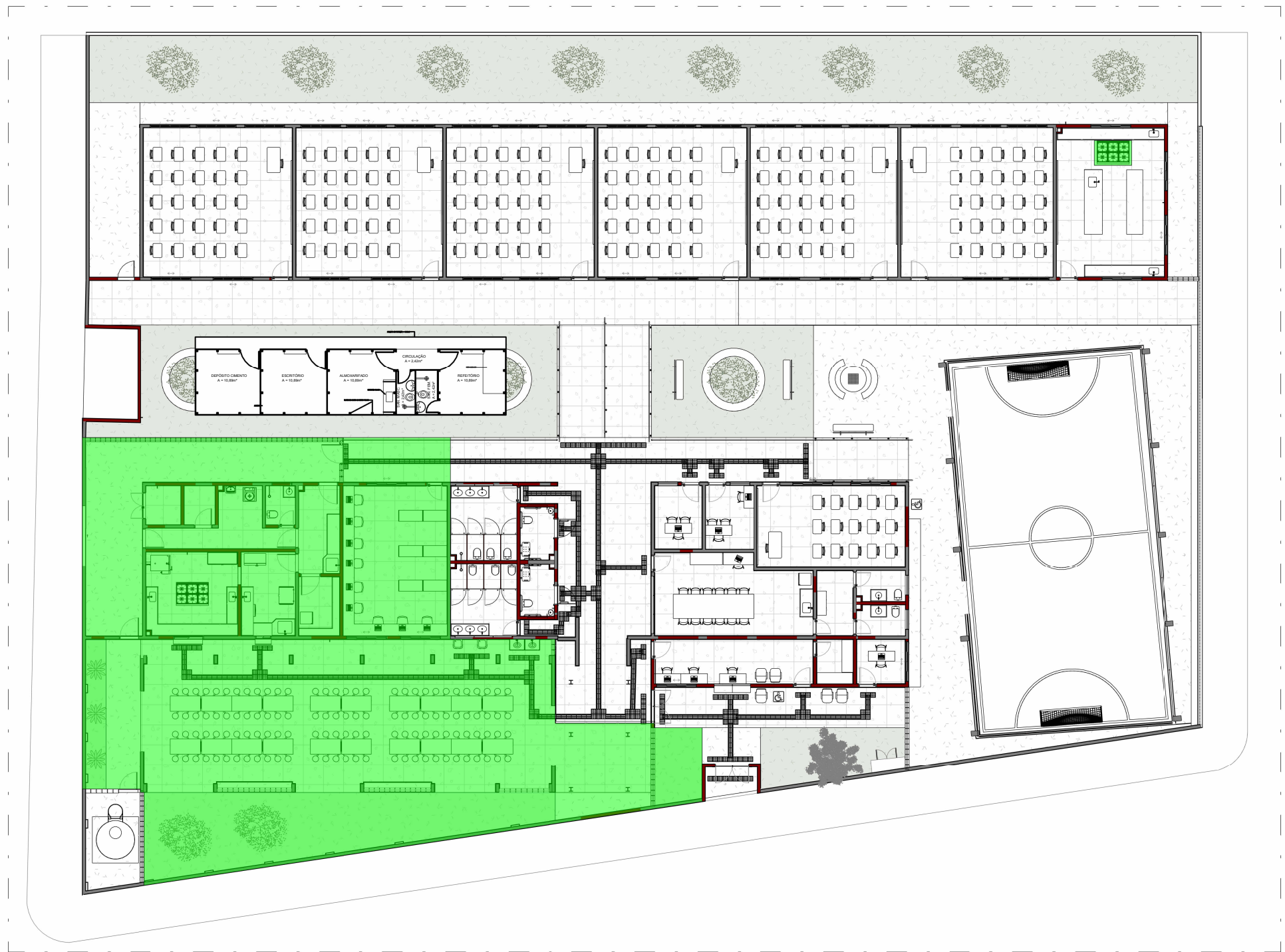
5 4ª ETAPA ESCALA 1 : 250