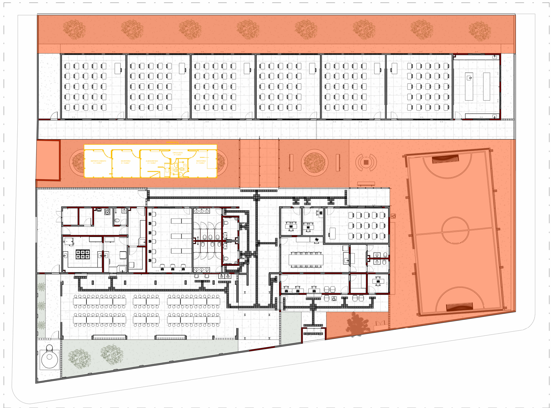
6 5ª ETAPA ESCALA 1 : 250